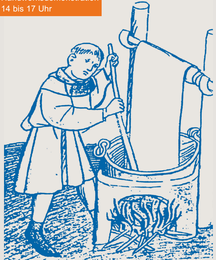
Mittelalterliche Darstellung der Blaufärberei aus dem Hausbuch der Mendelschen Zwölfbrüderstiftung; 15./16. Jahrhundert.